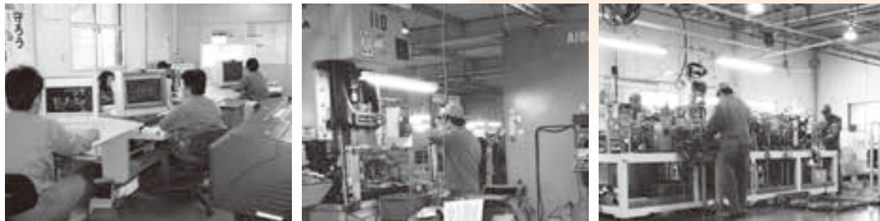
一貫生産体制（開発設計、プレス加工、組立）