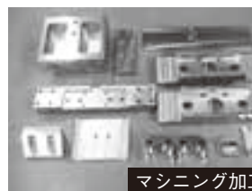
マシニング加工品