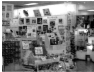
「カメラのコセキ」店舗