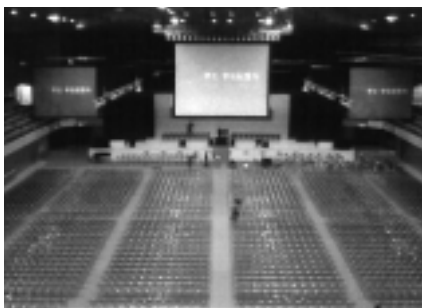
イベント等のプロモーション