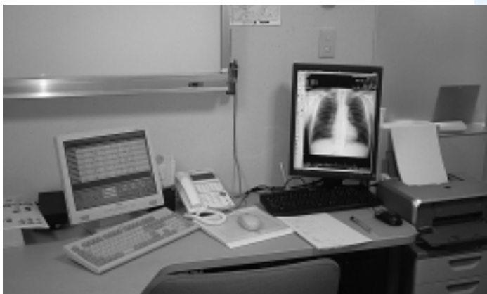
取扱商品（医療システム）