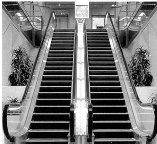
エスカレータ用ハンドレール