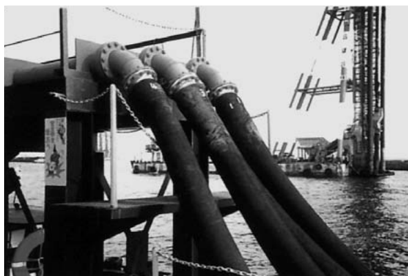
大口径長尺ホース