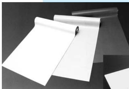
エレリーク (静電気帯電防止シート)