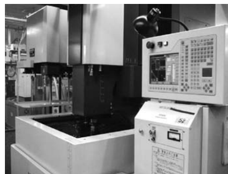
マシニングセンター