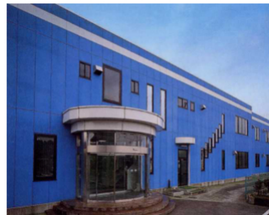
本社・高清水工場

車載用電装部品（キーレスエントリー、IPパナクシステム、IPコパネルター、パワーウィンドスイッチ等）メインにを製造。当社を核とする「北光グループ」は、最新鋭のCAD/CAMシステム、三次元CADを駆使して各種金型設計・製作・試作からプレス加工・成形加工部品製造、塗装、印刷、製品組立、検査、出荷に至るまで独自の一貫生産システムを構築。顧客ニーズに合致した質の高い製品・サービスの提供を行っている。