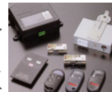
キーレスエントリー

また、単なる大手メーカーの下請け・受注にとどまらず、オリジナルな発想で製品の企画・提案を行っていく社内体制が確立しており、日産自動車の「キーレスエントリー」に代表される高い製品開発力の原動力となっている。。