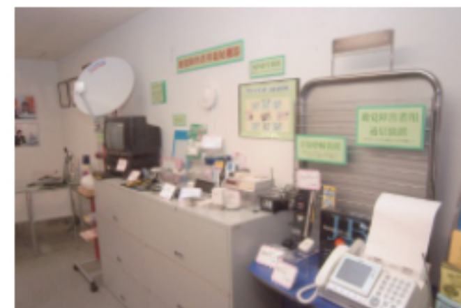
聴覚障害者用福祉機器

さらにNTTME東北と共同で聴覚障害者のために、パソコンでのトラブル解決や円滑な手続きのサポートも開始している。今後は、障害者向けのサービスとして手話がわからない聴覚障害者のための遠隔筆談、視覚障害者が歩行する際の遠隔サポート、そして災害時における情報受信サポートに加えて、外国人のための遠隔通訳、寝たきりの高齢者に対する日常生活の遠隔サポートなど業務の多様な広がりも期待される。