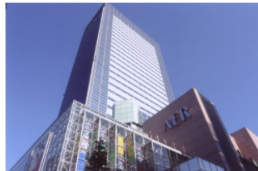
本社のあるアエル

当社が独自に開発したテレビ電話受付システムを利用して、企業等の窓口や視聴覚障害者の自宅とコールセンターをつなげ、手話通訳者等のサポーターが手話・筆談・音声による説明、情報提供を行い、視聴覚障害者のコミュニケーションを仲介するサービスを提供している。一般企業や公共機関への導入を積極的に営業展開中である。