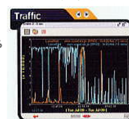
トラフィック監視